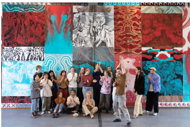
Blikvanger van Collective Making was de muurschildering die achttien studenten in vijf dagen realiseerden in de kantine in Arnhem.