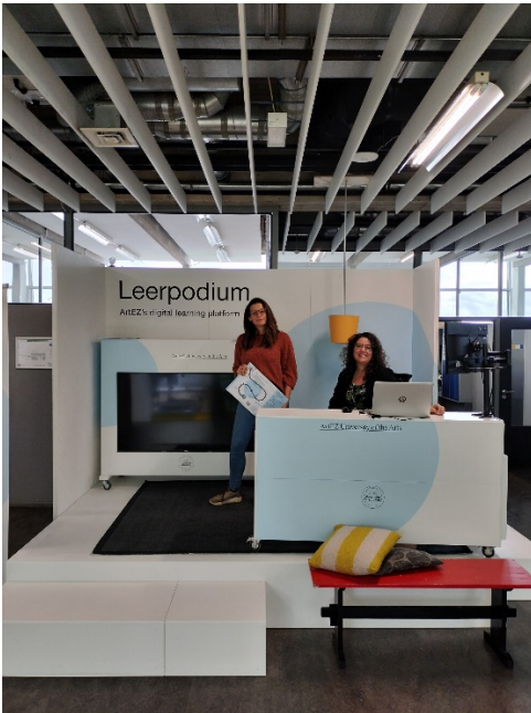
Informatiepunt Leerpodium met digicoaches. De stand is ontworpen door een student van de opleiding Product Design.

Een ArtEZ-brede studentenklankbordgroep (met leden uit de MR en daarbuiten) heeft geadviseerd over het uitbreiden van het aanbod op de landelijke minorenwebsite Kies op Maat en over de studentenpsycholoog. Voor de implementatie van het nieuwe leermanagementsysteem Leerpodium heeft een student van de opleiding Product Design twee informatiepunten ontworpen waar docenten en studenten met vragen langs kunnen lopen.