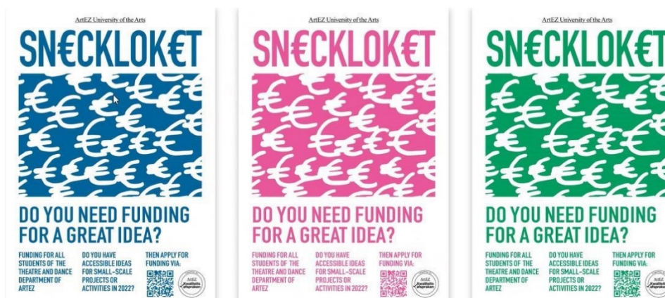
Eén van de posters die is vormgegeven door studenten van de Academie voor Art & Design

Studenten worden zoveel mogelijk betrokken bij de initiatieven en maken soms zelf ook communicatiemiddelen. Zo werd in september bij de Academie voor Theater & Dans een avond georganiseerd waar alle studenten uitleg kregen over de doelstellingen en projecten van de kwaliteitsafspraken en waar ze ideeën konden delen. Studenten van de Academie voor Art & Design Arnhem ontwierpen posters rond initiatieven van het programma Kwaliteitsafspraken.